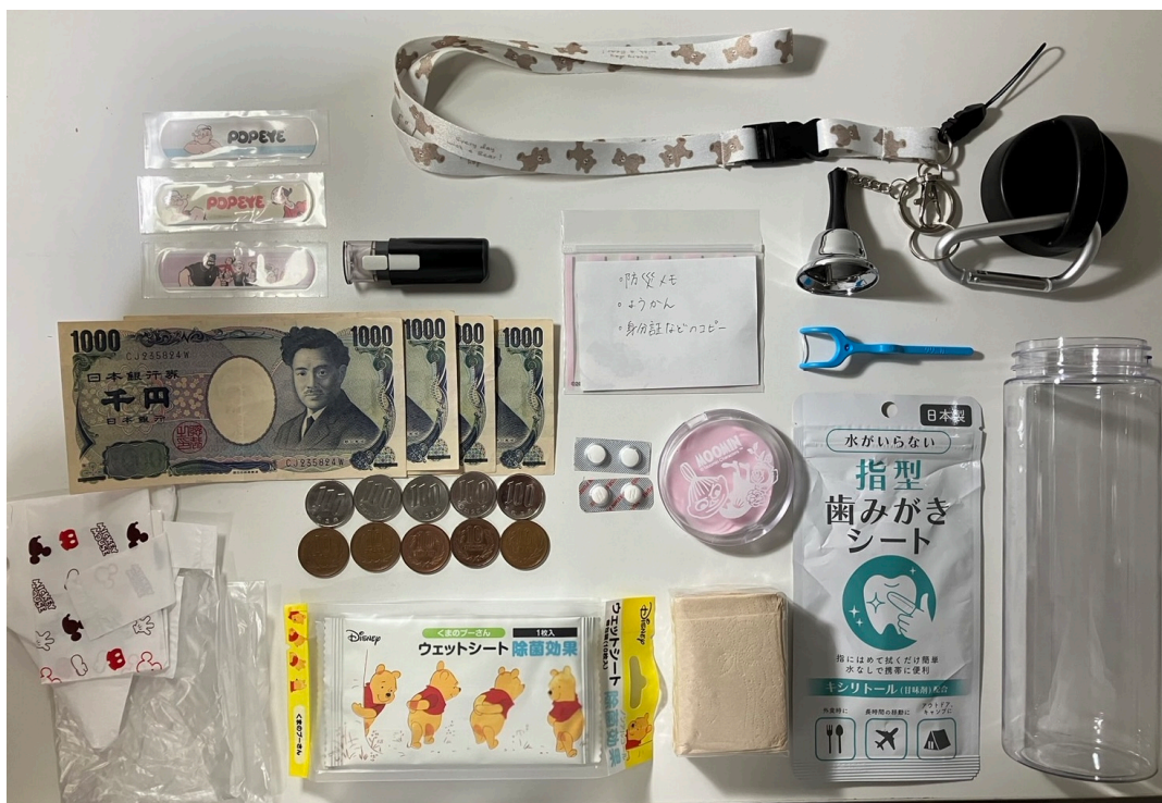
図3 防災ボトルの内容物

防災講習会では全学年に防災ボトルの有用性について発表する事が出来た。防災ボトルはプラスチック製のボトルに非常用防災グッズを詰めて手軽に作成できるもので、防水性がある事、手軽に持ち運べる事、自分に必要な物を自由に詰めれることなどから防災ボトルをもっと広めたいと思い、発表に至った。実際に自分で防災ボトルを作成して感じた事は、見た目よりもたくさん物が入れる事、100円ショップには被災生活に役立つ物が多い事、とてもアレンジがしやすい事だ。私はプラスチックのボトルにカラビナを付けて、さらにネックストラップと鈴を繋げた。中には現金や印鑑、重要な書類のコピーなど、避難する時の必要最低限のものを入れた。また、ほとんどの物を100円ショップで揃える事が出来た。