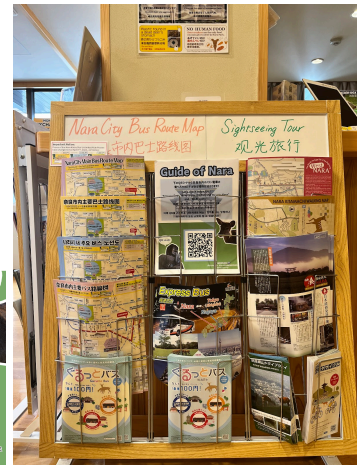
図3 奈良県外国人観光客交流館に設置