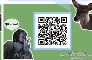
図2 作成したチラシ

下のQRコードから奈良市内のバス・電車の乗り方やWi-Fiがある場所が分かります！ Let's check below QR! You can find "How to use the bus and train in Nara" and "Wi-Fi spots"! 検査下記のQR、奈良市街市内野山電車・電車の乗車方法とWi-Fiスポット！ 아래 QR를 스캔하고 나라시내의 버스・전차를 타는 방법이나 와이파이기가 있는 소식이 알 수 있습니다!